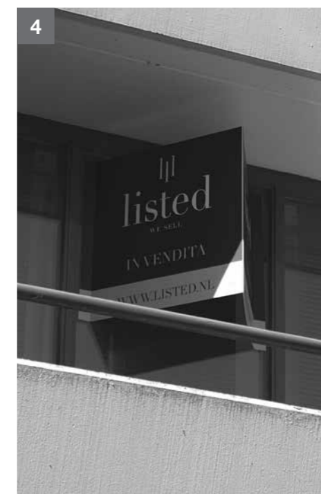
Heb je alles gevonden? Zo niet, vind je hier de exacte plekken. Foto 1: Hoekkestraat 47 €389,000 | Foto 2: Sint Rochusstraat 40 €380,000 | Foto 3: Sint Rochusstraat 64 €569,000 Foto 4: Rozenluis 13 €375,000. Hopelijk heb je een beetje plezier gehad aan de quiz. Volgende keer hebben we weer nieuwe plekken voor je klaar om je wijk te leren kennen en te ontdekken. Tot dan!