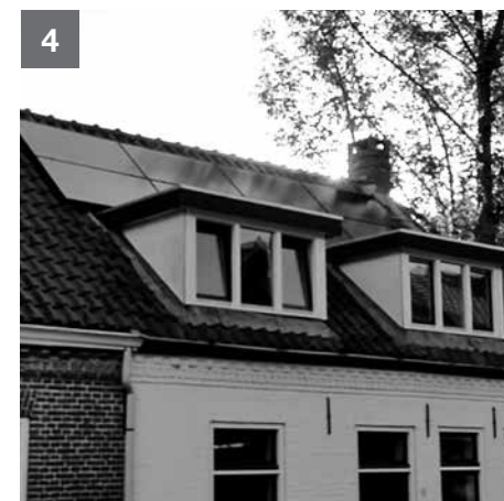
Heb je alles gevonden? Zo niet, vind je hier de min of meer exacte plekken. Foto 1: Hoefstraat 14 en 16 | Foto 2: Hoefstraat 68 en 70 | Foto 3: Joristaan 72 | Foto 4: Tunstraat 5. Hopelijk heb je een beetje plezier gehad aan de quiz. Volgende keer hebben we weer nieuwe plekken voor je klaar om je wijk te leren kennen en te ontdekken. Tot dan!

Maar hoeveel oog voor detail heb je eigenlijk? We bieden je de kans om jezelf te testen. Of je gaat eens op zoek naar de plekken waar wij deze foto's hebben gemaakt. Succes met zoeken en vooral vinden van onze 4 gekozen plekken!! Antwoorden vind je onder aan de pagina. De Redactie